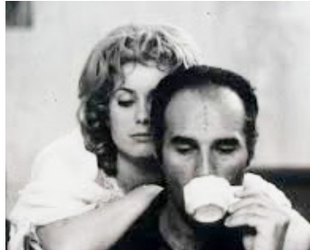
1966 LES CRÉATURES d'Agnès Varda avec Michel Piccoli