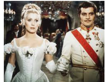
1968 MAYERLING (Mayerling) de Terence Young avec Omar Sharif