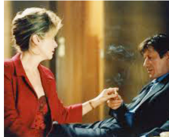
1998 PLACE VENDÔME de Nicole Garcia avec Jacques Dutronc