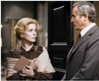
1976 ÂMES PERDUES (Anima Persa) de Dino Risi avec Vittorio Gassman