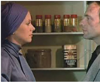
1974 L'AGRESSION de Gérard Pirès avec Jean-Louis Trintignant