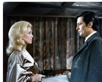
1972 UN FLUC de Jean-Pierre Melville avec Alain Delon