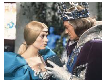
1970 PEAU D'ÂNE de Jacques Demy avec Jean Marais