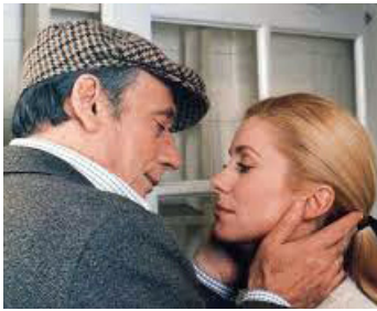
1981 LE CHOIX DES ARMES d'Alain Corneau avec Yves Montand