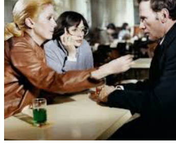
1978 L'ARGENT DES AUTRES de Christian de Chalonge avec Juliet Berto, J.-L. Trintignant