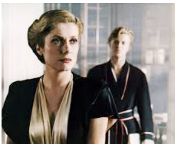
1983 LES PRÉDATEURS (The Hunger) de Tony Scott avec David Bowie