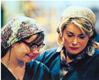
2000 DANDER IN THE DARK (Dancer in the Dark) de Lars von Trier avec Björk