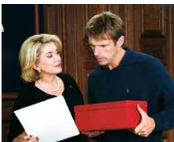
2005 PALAIS ROYAL ! de Valérie Lemercier avec Lambert Wilson