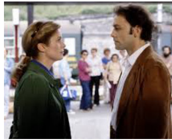
1981 HÔTEL DES AMÉRIQUES d'André Téchiné avec Patrick Dewaere