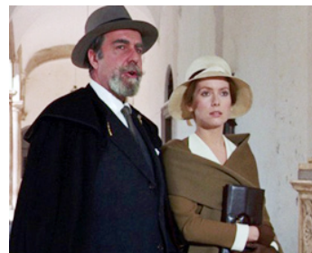
1970 TRISTANA de Luis Buñuel avec Fernando Rey