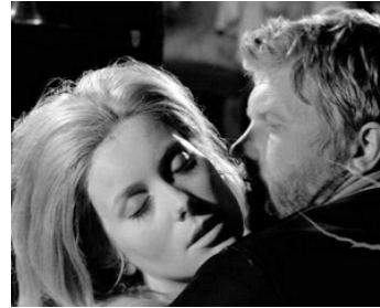
1965 LE CHANT DU MONDE de Marcel Camus avec Hardy Krüger