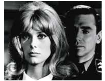
1962 LE VICE ET LA VERTU de Roger Vadim avec Robert Hossein