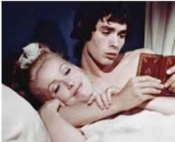
1967 BENJAMIN ou LES MÉMOIRES D'UN PUCEAU de M. Deville avec Pierre Clémenti