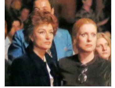
1976 SI C'ÉTAIT À REFAIRE de Claude Lelouch avec Anouk Aimée