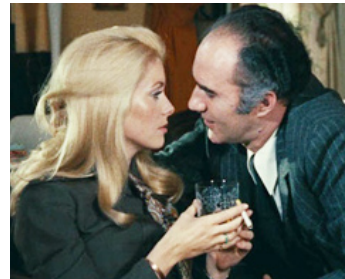
1968 LA CHAMADE d'Alain Cavalier avec Michel Piccoli