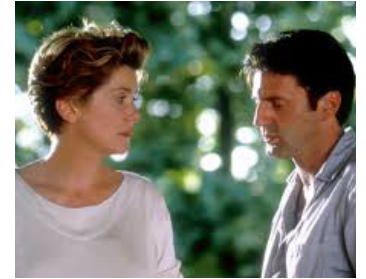
1993 MA SAISON PRÉFÉRÉE d'André Téchiné avec Daniel Auteuil