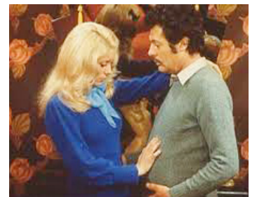
1972 L'ÉVÉNEMENT LE PLUS IMPORTANT... de Jacques Demy avec Marcello Mastroianni