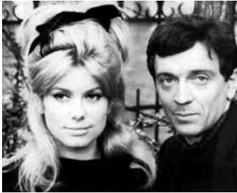
1963 LES PLUS BELLES ESCROQUERIES DU MONDE de C. Chabrol avec Jean-Pierre Cassel