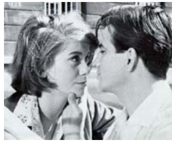
1957 LES PORTES CLAQUENT de Jacques Poitrenaud avec Maurice Sarfati