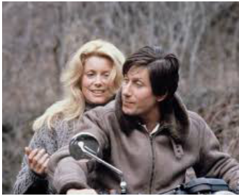
1979 À NOUS DEUX de Claude Lelouch avec Jacques Dutronc