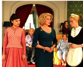
2001 HUIT FEMMES de François Ozon avec Virginie Ledoyen, Emmanuelle Béart