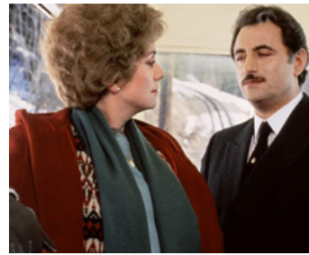
1987 AGENT TROUBLE de Jean-Pierre Mocky avec Richard Bohringer