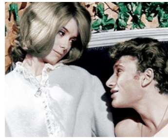
1961 LES PARISIENNES, sketch Sophie de Mark Allégret avec Johnny Hallyday