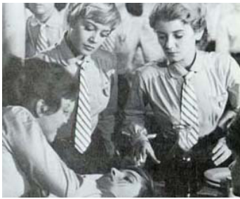
1956 LES COLLÉGIENNES d'André Hunebelle avec Elga Andersen