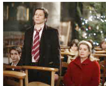
2008 UN CONTE DE NOËL d'Arnaud Desplechin avec Mathieu Amalric