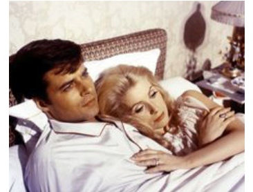
1967 BELLE DE JOUR de Luis Buñuel avec Jean Sorel