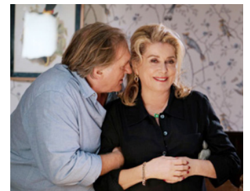
2017 BONNE POMME de Florence Quentin avec Gérard Depardieu