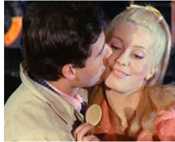
1964 LES PARAPLUIES DE CHERBOURG de Jacques Demy avec Nino Castelnuovo