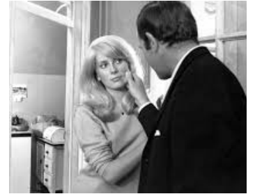
1965 RÉPULSION de Roman Polansky avec Ian Hendry