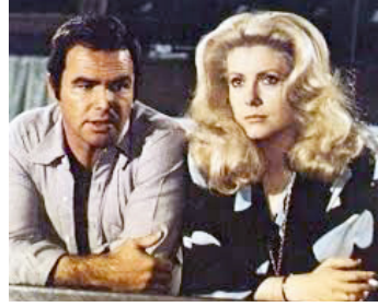
1975 LA CITÉ DES DANGERS (Hustle) de Robert Aldrich avec Burt Reynolds