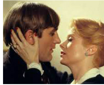
1980 LE DERNIER MÉTRO de François Truffaut avec Gérard Depardieu