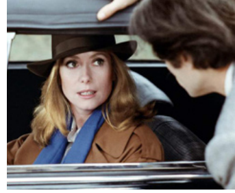
1978 ÉCOUTE VOIR de Hugo Santiago avec Sami Frey