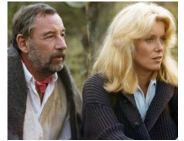
1983 L'AFRICAIN de Philippe de Broca avec Philippe Noiret