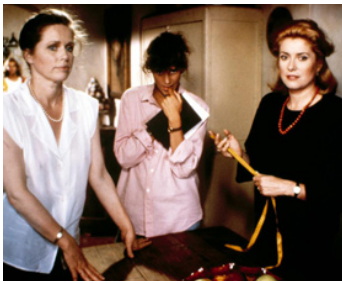
1986 POURVU QUE CE SOIT UNE FILLE (Speriamo che sia femmina) de M. Monicelli avec Liv Ullmann