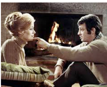
1969 LA SIRÈNE DU MISSISSIPPI de François Truffaut avec Jean-Paul Belmondo