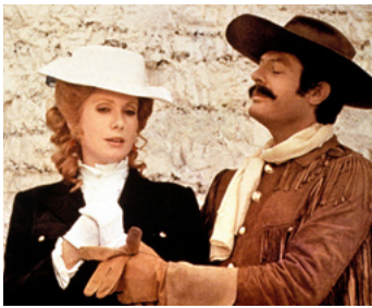
1973 TOUCHE PAS À LA FEMME BLANCHE de Marco Ferreri avec Marcello Mastroianni