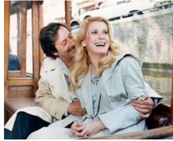
1979 COURAGE FUYONS d'Yves Robert avec Jean Rochefort