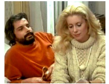
1974 LA FEMME AUX BOTTES ROUGES de Juan Luis Buñuel avec Jacques Weber