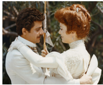
1974 LA GRANDE BOURGEOISE (Fatti di gente perbene) de M.Bolognini avec Giancarlo Giannini/