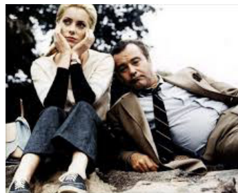
1969 FOLIES D'AVRIL (April Fools) de Stuart Rosenberg avec Jack Lemmon