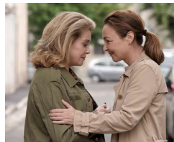
2016 SAGE-FEMME de Martin Provost avec Catherine Frot