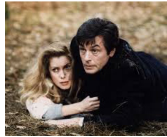
1982 LE CHOC de Robin Davis avec Alain Delon