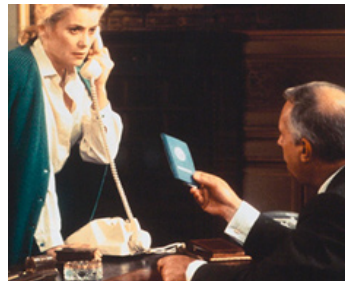
1984 LE BON PLAISIR de Francis Girod avec Michel Serrault