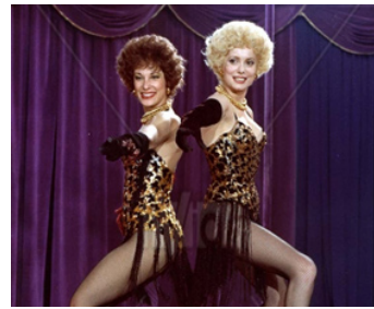
1974 ZIG-ZIG de Laszlo Szabo avec Bernadette Lafont