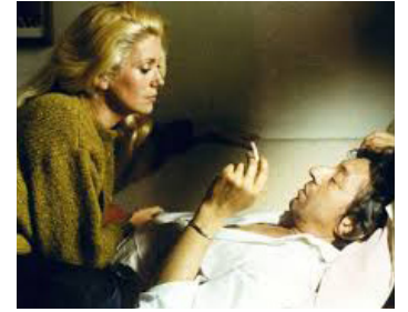
1980 JE VOUS AIME de Claude Berri avec Serge Gainsbourg