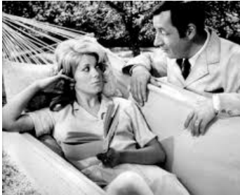
1965 LA VIE DE CHÂTEAU de Jean-Paul Rappeneau avec Philippe Noiret