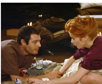
1971 ÇA N'ARRIVE QU'AUX AUTRES de Nadine Trintignant avec Marcello Mastroianni