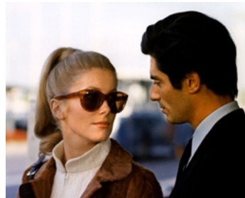
1967 MANON 70 de Jean Aurel avec Sami Frey