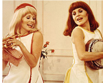
1967 LES DEMOISELLES DE ROCHEFORT de Jacques Demy avec Françoise Dorléac