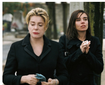
2007 APRÈS LUI de Gaël Morel avec Élodie Bouchez