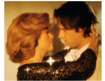
1984 PAROLE ET MUSIQUE d'Elie Chouraqui avec Christophe Lambert