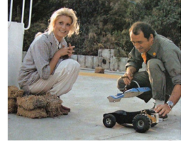
1978 ILS SONT GRANDS, CES PETITS de Joël Santoni avec Claude Brasseur