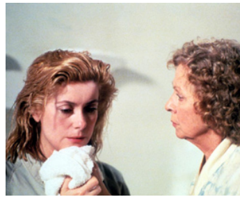
1986 LE LIEU DU CRIME d'André Téchiné avec Danielle Darrieux