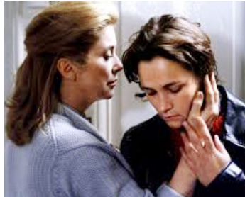
1996 LES VOLEURS d'André Téchiné avec Laurence Côté