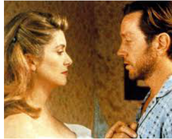
1990 LA REINE BLANCHE de Jean-Loup Hubert avec Bernard Giraudeau