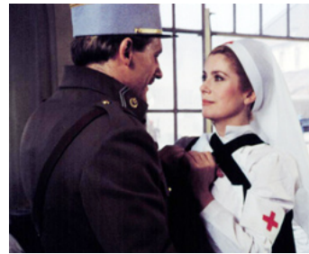
1984 FORT SAGANNE d'Alain Corneau avec Gérard Depardieu