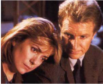
1988 FRÉQUENCE MEURTRE d'Élisabeth Rappeneau avec André Dussolllier