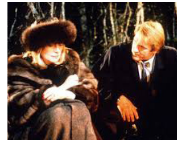
1987 DRÔLE D'ENDROIT POUR UNE RENCONTRE de François Dupeyron avec Gérard Depardieu