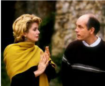
1995 LE COUVENT (O Convento) de Manoel de Oliveira avec John Malkovich