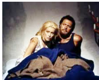
1971 LIZA (La Cagna) de Marco Ferreri avec Marcello Mastroianni